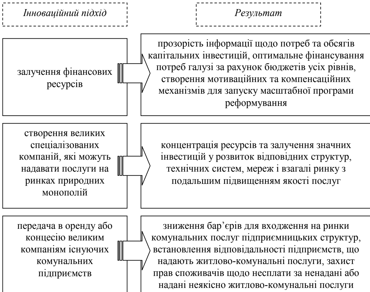
Рис. 4. Інноваційні підходи державного регулювання розвитку житлово-комунального господарства