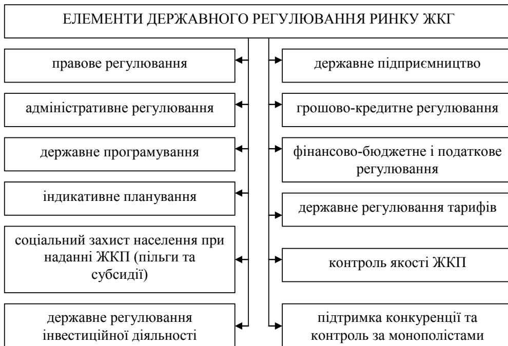
Рис. 1. Елементи державного регулювання ринку ЖКГ

Кожний функціональний складник виконує власні функції за допомогою таких засобів,