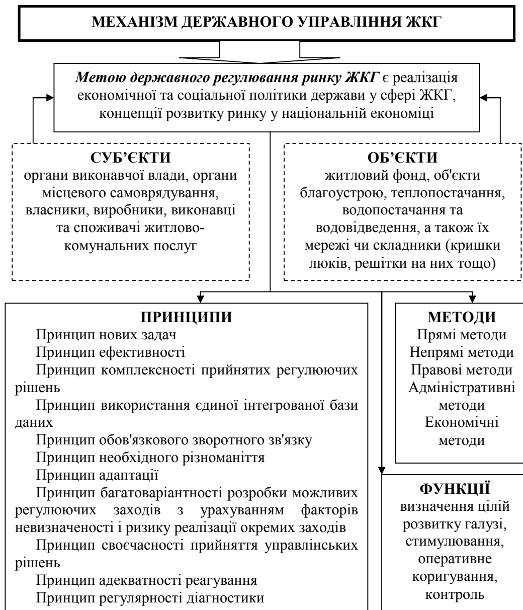
Рис. 2. Механізм державного управління та регулювання сфери ЖКГ

За способами впливу виокремлюють прямі та непрямі методи державного регулювання ринку ЖКГ, які встановлюють певні умови для суб'єктів фінансового ринку. Як засіб доповнення сукупного попиту, який включає запровадження трансфертних виплат населенню, прямих державних інвестицій, субвенцій, дотацій, субсидій для населення, бюджетів нижчого рівня, підприємств тощо, використовують методи прямого впливу. До прямих методів державного регулювання, зокрема, відносять систему штрафів, обмежень, ліцен-