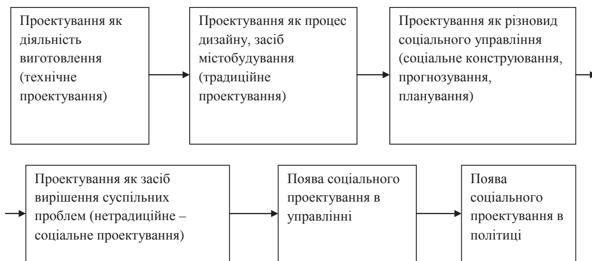
Рис. 1. Розвиток соціального проектування

З середини ХХ ст. відбувається технічна революція, яка дає новий поштовх для розвитку соціального проектування. В цей період соціальна інженерія починає спиратися на соціальні знання. У зв'язку з цим починається розвиватися така сфера, як проєк-